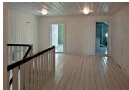
Fra andre etasje med opprinnelig gulv og veggpanel