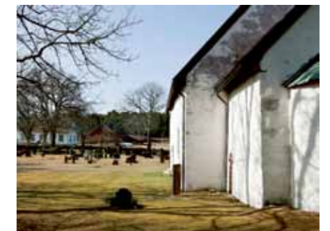
Dette bildet viser presteboligen nærhet til Hvaler kirke – en av landets aller eldste