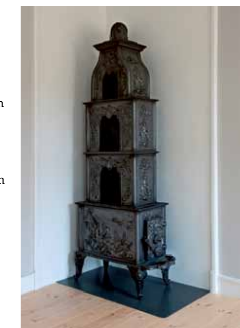
Etasjeovnen fra Eidsfos

„ Drengestua som har hørt til prestegården, er fra 1799, eldste hus etter kirken, og kirken med omgivelser er blitt valgt ut som kommunens tusenårssted.